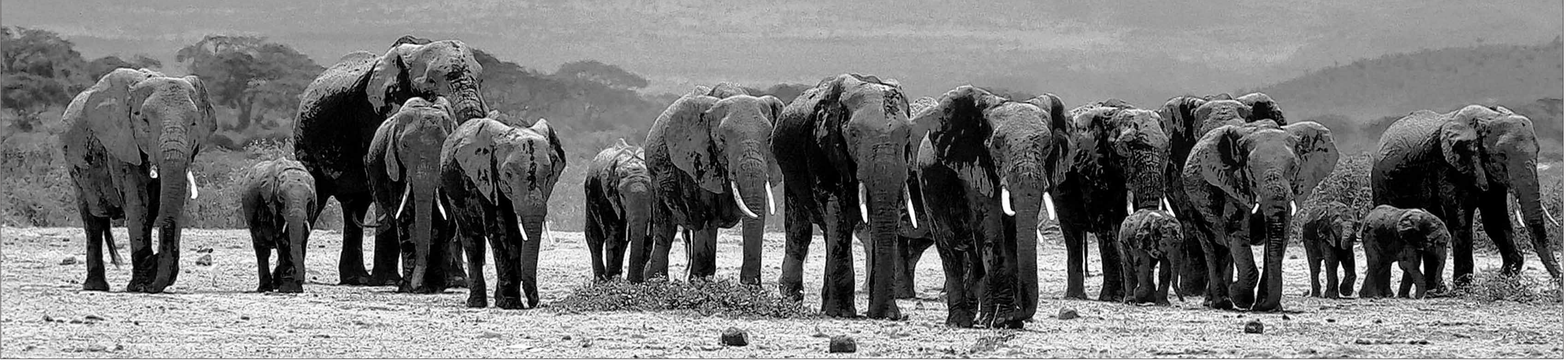
● Een kudde olifanten is gevlucht van een chaotisch Congo naar buurland Uganda.