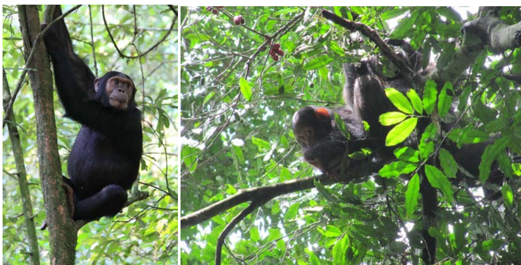
Chimps in Kibale Forest!

We zullen de lunch op de eerste dag niet redden, dus we zullen onderweg lunchen of een lunchpakket meenemen van KonTiki. Lunch is niet inbegrepen.