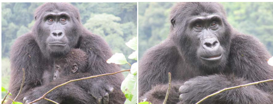
Op gorillatracking in Rwanda (deze tracking is minder zwaar dan in Oeganda!!)